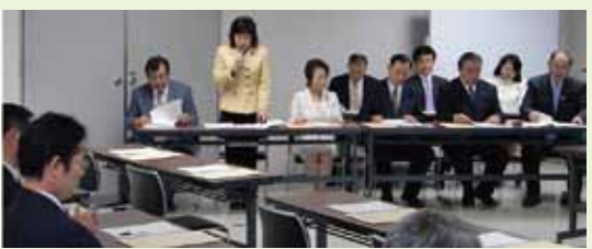
(連盟の幹事長を務めています)

議連では一年間役員会にて長野県の現状把握のため各種団体の意見発表、提言、要望を受けて来ましたが、その中から3団体に意見表明を頂きました。また、次年度は引き続き、何が課題でどんな施策が欠けているかを把握する為、他県への調査および講演会の企画など計画の承認を受けました。