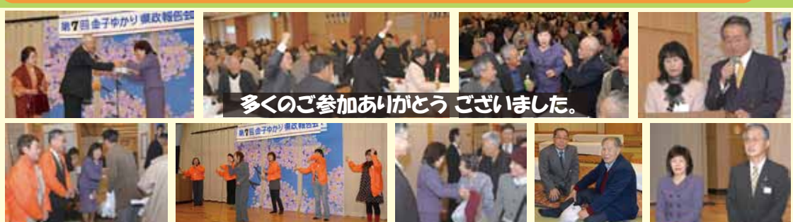
多くのご参加ありがとうございました。