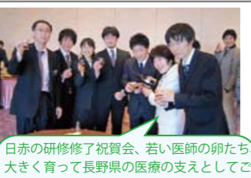
日赤の研修修了祝賀会、若い医師の卵たち、大きく育って長野県の医療の支えとして活躍を期待しています。