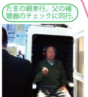
たまの親孝行。父の補聴器のチェックに同行。