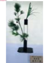
春の華展に久しぶりに出展しました。松とアイリスの二重掛け。