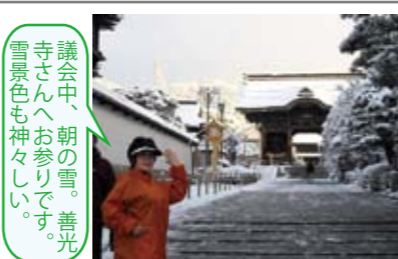
議事中、朝の雪。善光寺さんへお参りです。雪景色も神々しい。

1日 〔議案〕 本会議（一般質問）、選挙区・定数研究会（一人区・飛び地について） 2日 〔議案〕 本会議（一般質問、「信州の水産食文化を味わい広める会」、県庁三田会） 3日 〔議案〕 長野県接骨学会前夜懇談会 4日 〔議案〕 接骨学会講演会（東京大学疾患生命工学センター放射性分子医学部門・宮川清教授） 5日 〔議案〕 委員会（建設委員会）、ワイン振興議員連盟設立総会、砂防事業研究会 6日 〔議案〕 委員会（建設委員会） 7日 〔議案〕 委員会（建設委員会）、がん征圧議員連盟総会（がん対策推進条例（仮称）制定検討調査会設置）（幹事長に就任） 8日 〔議案〕 委員会（建設委員会）、子どもの環境整備協議連役員会、スポーツ振興議員連盟役員会 9日 〔議案〕 委員会（危機管理委員会）、日中友好促進議員連盟勉強会、危機管理建設委員会懇談会 10日 〔議案〕 斉藤松本教育委員長励ます会 11日 〔議案〕 ガールスカウト第7回フライアップ式 12日 〔議案〕 広報委員会、砂防協会懇談会、信州青年洋上セミナーの船幹事会 13日 〔議案〕 本会議（議案採決、第一回がん対策推進条例（仮称）制定検討調査会） 14日 選挙区・定数研究会（一票の格差、議員定数について） 15日 〔議案〕 会派総会、本会議、議会役員選任 16日 〔議案〕 議会役員選任、ロシア講演会（駐日ロシア特命全権大使） 17日 〔議案〕 本会議（閉会日）、諏訪赤十字病院臨床研修修了祝賀会、豊田区長会 18日 自衛隊入隊者激励会、諏訪市ベタンク協会総会、お彼岸お墓参り 19日 長野県財政課長、健康福祉部長他懇談会、諏訪二葉高校同窓会地区幹事打ち合わせ 20日 〔議案〕 建設事務所懇談会 21日 諏訪市体育連盟総会懇親会、諏訪市華道会春の華展準備 22日 第9回諏訪市いけばな展、諏訪市身体障害者福祉協会総会、聖母の会理事・評議員会、諏訪市県派遣職員歓迎会 23日 諏訪高等職業訓練校修了・入校式 24日 日本さくらの会総会&功労者表彰式、原弘展（国立近代美術館、震災寄付「絆」絵画展） 25日 諏訪森林組合の30周年祝賀懇親会 26日 厚生連老人保健施設と診療所「みづうみ」竣工祝賀会、社会福祉法人聖母の会歓送迎会 27日 商工会議所主催講演会（大島啓介氏、区長、市役所、事務所他打ち合わせ） 28日 企業・市民相談、諏訪市少年野球会新旧引き継ぎ会、事務所打ち合わせ（県政報告会準備）