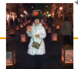
▲2/15 議会の合間、長野善光寺燈明祭りに