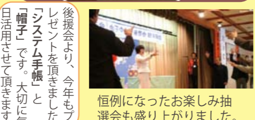
恒例になったお楽しみ抽選会も盛り上がりしました。