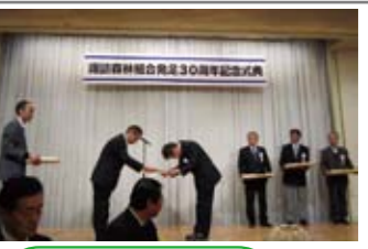
30周年節目に表彰、おめでとうございます。