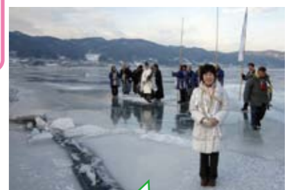
4年ぶりに諏訪湖にお神渡りが出現、拝観式に。