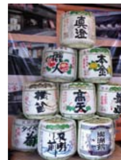
上諏訪駅に九銘柄の地元の酒樽です