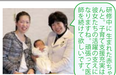
研修中に生まれた赤ちゃん。子育て支援充実は彼女たちの活躍の支えになります。頑張る支えに師を続けて欲しいです。