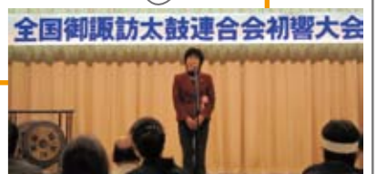
全国御諏訪太鼓連合会初響大会。全国から集結した太鼓仲間を激励しました。