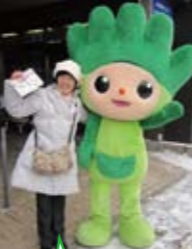
「をかしまつり」に技能五輪のわざまる君も応援に